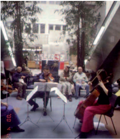
Figura 5 – La música como terapia

El Prof. Paul Robertson (2001) sugiere que la música está ligada al bienestar, y que programas adecuadamente diseñados de músico-terapia alivian el dolor y reducen el stress en los pacientes.