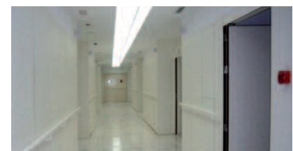
Figura 9 Hospital de Mollet- Lucernario en planta 1ª