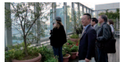
Figura 8 Terraza con vistas