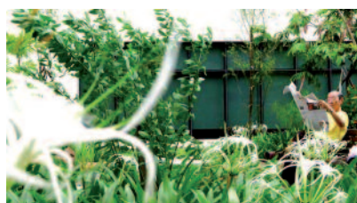
Figura 2 Un paciente lee un periódico en un espacio verde de un hospital de Tokyo