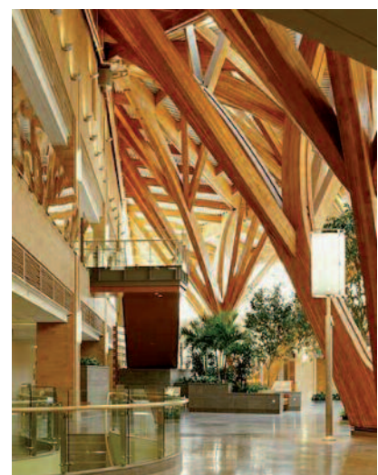
Figura 4 – Diseño de un atrio