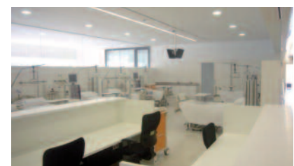
Hemodiálisis en semisótano con luz natural