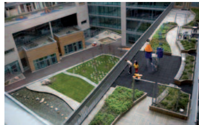
Figura 6 – Jardines

experiencia, que combina la asistencia médica con las medidas preventivas, información sobre la salud, promoción del bienestar y de la calidad de vida.