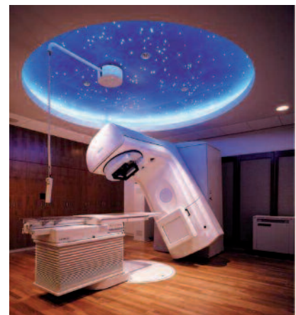
Figura 3 – Ambientación en Radioterapia